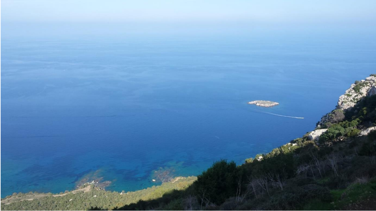
- Governor's Beach à mi-chemin entre Limassol et Larnaka