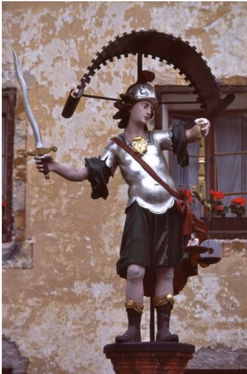
Fontaine de Burgeis (direction Resia).