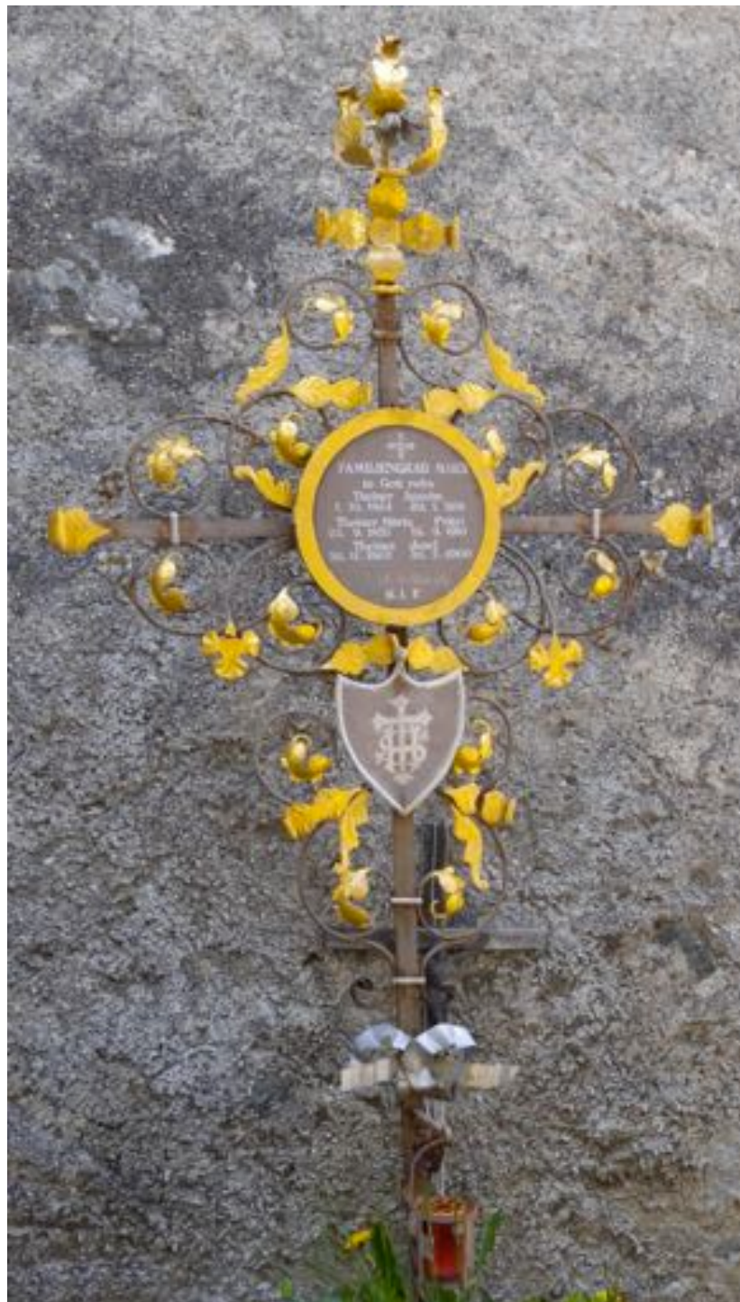
Au cimetière de Burgeis.