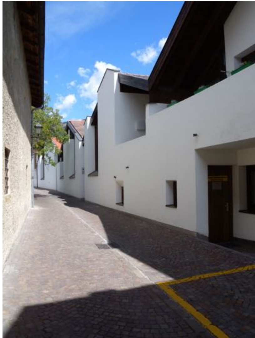
Architecture moderne bien intégrée.