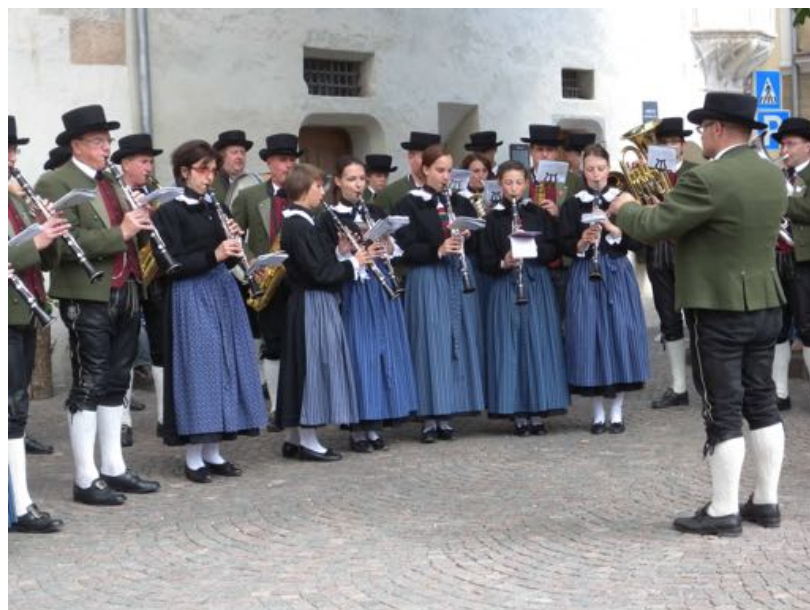
Un divertissement d'été sur la place.