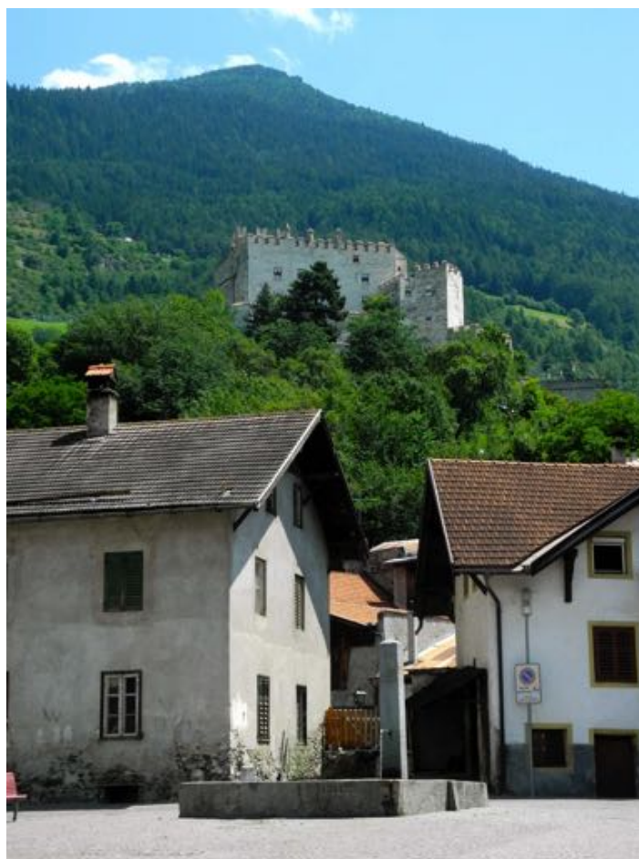
Un château pour terminer, le Churburg de Schluderns.