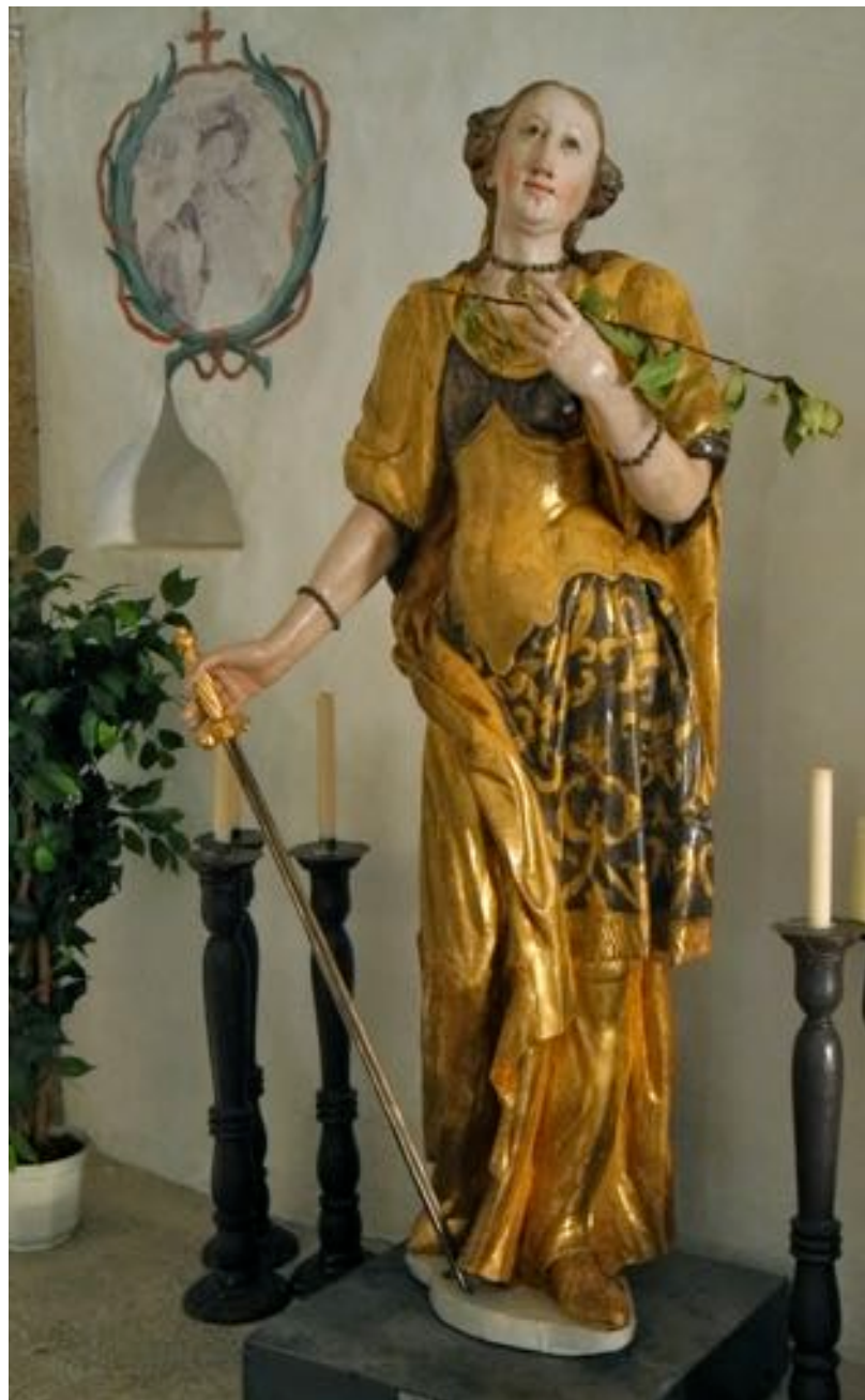
Cette avenante sainte Catherine nous attend avec d'autres compagnons dans la vaste chapelle qui jouxte l'église de Schluderns.