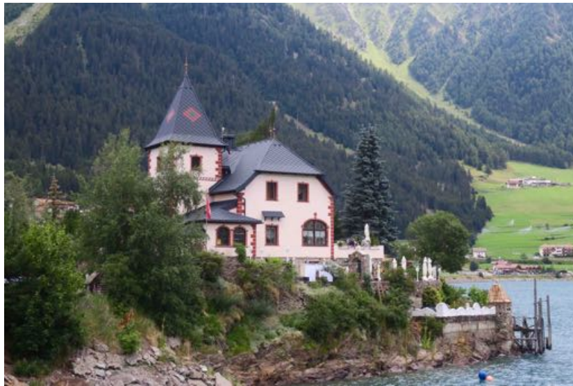
L'auberge (non testée) à l'extrémité nord du lac.

promeneurs et picniqueurs de l'été sont parquées en une file continue.