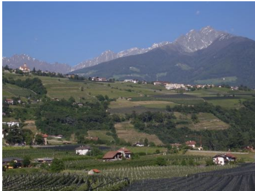
Vue nord depuis la chambre. Rien à redire.