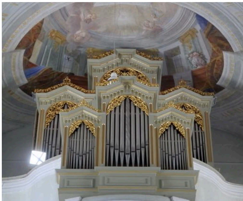
Eglise de Schlanders.

Il y a autant d'églises que l'on veut, au moins quinze pages sur le site de l'Office du tourisme. Celle de Schlanders (page précédente) a belle allure.