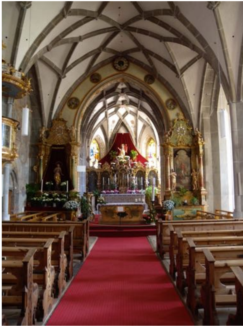
Intérieur de l'église de Schluderns.