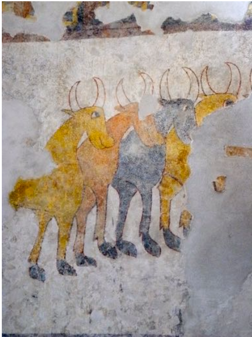
Procession des animaux à l'église pré-romane Saint-Proculus à Naturns...