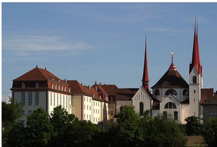
Abbaye de Muri

Le Musée suisse de la paille , situé à Wohlen, dans la villa construite pour le fabricant de paille August Isler vers 1860, il est consacré à l'histoire de l'industrie de la vannerie dans le Freiamt argovien. La fabrication de chapeaux et d'autres articles en paille a débuté au XVIIIe siècle sous forme de travail à domicile et a atteint son apogée au XIXe siècle. La région autour de Wohlen est devenue un centre réputé de la vannerie, aux produits commercialisés à une échelle internationale.