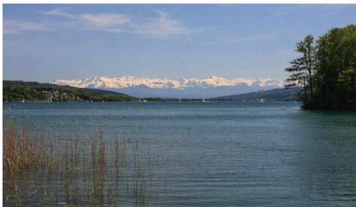
Lac de Hallwyl